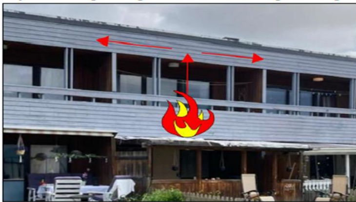
Figur 8 - visar brandens möjlighet att sprida sig fritt ovan balkongernas undertak